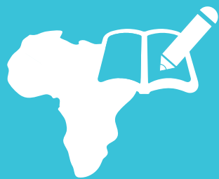
アフリカ教育支援受益者数