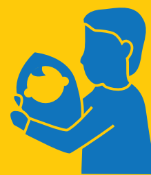
男性育児休業取得者数