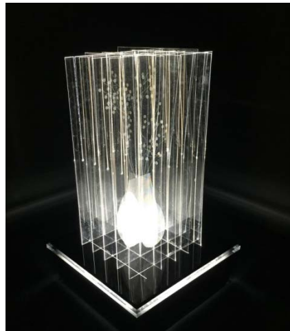
（今回出展するシースルー導光板）

高機能アクリルシート（商品名：テクノロイ®）を基材としたシースルー導光板を立体的に配置。透明印刷したデザインを3次元的に見せています。立体的な演出により、平面での表現にはないアクリルシートの新しい美しさを追求しており、当社高機能アクリルシートの透明感、薄さ、軽さ、シースルー導光板の多彩な表現力を体感できます。（本展示は単色デザインとなっています）