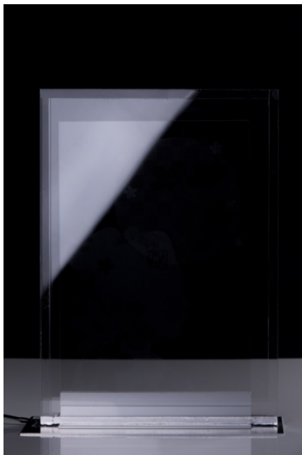
（端面のライトを消した状態では透明）

本製品には、液晶テレビ等に使用されるアクリル樹脂製導光板事業を通じて住友化学が20年以上にわたって培ってきた、導光板の印刷設計や透明インクの技術を応用しています。